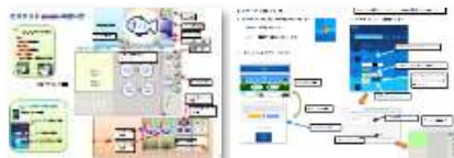
図4 ラミネート (両面)