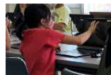
写真 指で画面を操作して作成