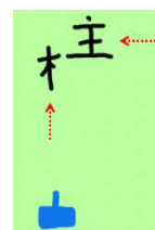
図3 漢字シューティングゲーム