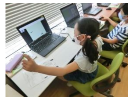
写真 プログラムを工夫できて喜ぶ様子